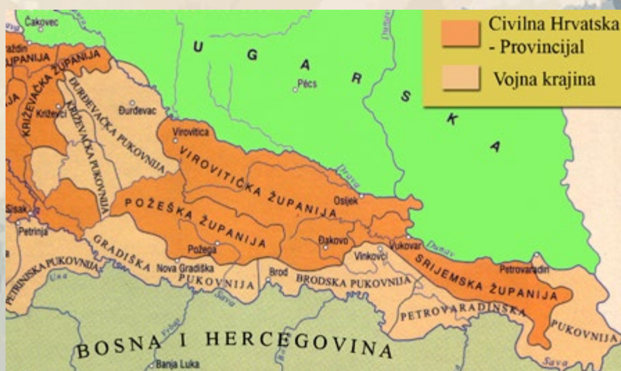
Slavonija u XVIII. stoljeću

Kako je Slavonija bila podijeljena nakon oslobođenja od Turaka? Tko je bio prvi vlasnik pakračkog vlastelinstva? Koliko je pakračko vlastelinstvo imalo sela? Nakon uspostave županija u Slavoniji kojoj je pripao pakrački kraj?