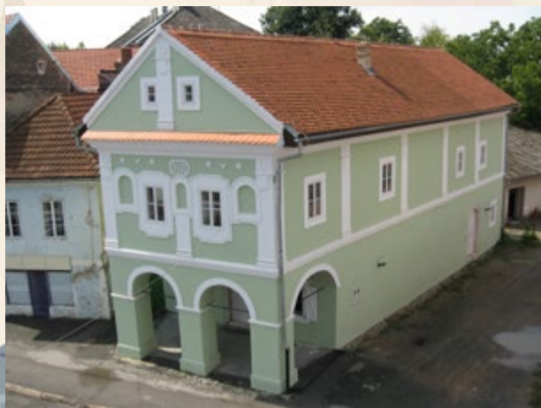
Varoška kuća izgrađena je 1771. godine za činovnike vlastelinstva, a kasnije je postala sjedište trgovišne općine Pakrac. Jedna je od najljepših zidanih općinskih baroknih zgrada u Hrvatskoj.