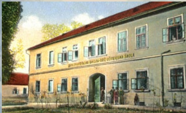
Trenkov dvorac u Pakracu u prošlosti služio je kao vojarna, bolnica i škola.

Pakračko vlastelinstvo od Imsenove udovice početkom 1745. godine kupuje barun Franjo Trenck. Od ranije posjeduje vlastelinstva Brestovac, Pleternicu i Veliku tako da pod svojim vlasništvom ima čak polovicu Požeške županije. Jedan je od najvećih slavonskih vlastelina. Njegov otac bio je austrijski časnik te i Franjo nastavlja vojnički poziv. Surovim mjerama iskorjenjuje hajdučiju po šumama oko Pakraca i Požege. Ubrzo dolazi u sukob s vlastima te odlazi na mnoga europska ratišta. Od dobrovoljaca i pomilovanih slavonskih hajduka osniva Trenkove pandure . S ovom postrojbom ratuje na strani carice Marije Terezije u Ratu za austrijsko nasljeđe. Trenkovi panduri izgledali su poput Turaka. Ulijevali su strah i trepet u svim zemljama gdje su ratovali. Prva su vojna postrojba u Europi koja je imala voj-