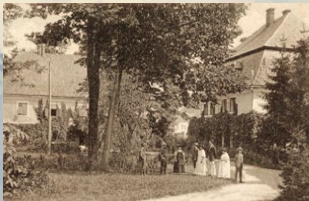
Park u kompleksu vlastelinstva Janković u Pakracu

Godine 1760. Antun Janković kupio je pakračko vlastelinstvo. Zajedno s vlastelinstvima Daruvar i Sirač to je bilo jedno od najvećih imanja u Slavoniji. U svom sastavu imalo je 36 sela, Sirač 13, a Daruvar 16. Nakon Antuna imanjem su upravljali njegovi nasljednici: Ivan, Izidor i Julije . Jankovići su znatno unaprijedili pakrački kraj. Poticali su razvoj stočarstva. Veliku pažnju posvećivali su uzgoju duda i dudova svilca. Na svoja imanja naseljavali su njemačke, češke i talijanske obrtnike, druge stručne radnike te tako unaprijeđivali manufakturu i obrt. Financirali su izgradnju škola i crkava.